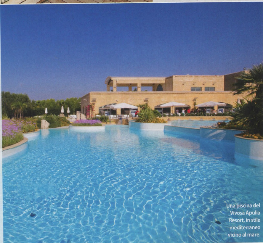
Una piscina del Vivosa Apulia Resort, in stile mediterraneo vicino al mare.

• Vivosa Apulia Resort, via Vicinale Fontanelle, Marina di Ugento (Lecce), tel. 0833.931002, vivosaresort.com ►