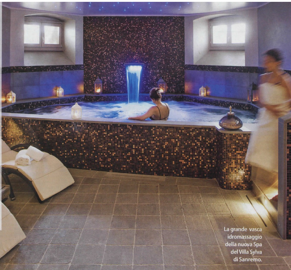
La grande vasca idromassaggio della nuova Spa del Villa Sylva di Sanremo.

• Hotel Villa Sylva, via Garbarino, Sanremo (Im), tel. 0184.505618, hotelvillasylva.com