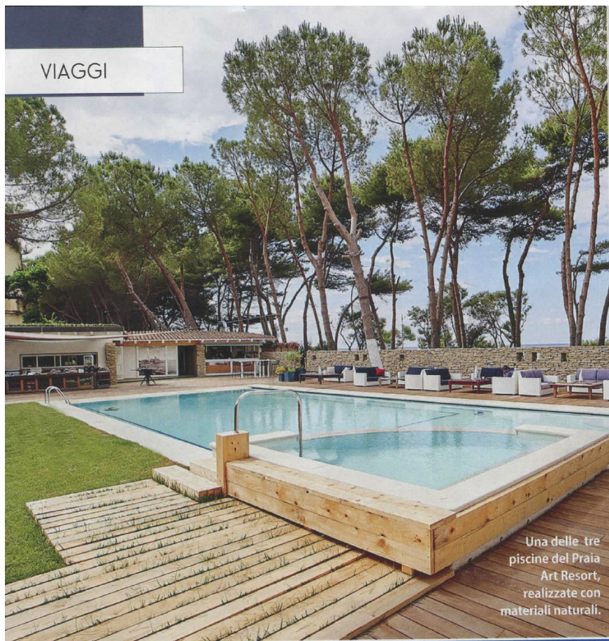
Una delle tre piscine del Praia Art Resort, realizzate con materiali naturali.

Immerso nel verde, arredato con opere d'arte, stanze tutte diverse, cucina naturale a venti metri dal mare: il Praia Art Resort si affaccia sull'area marina protetta di Capo Rizzuto, 42 chilometri di costa con sabbia, scogliere, acqua cristallina. Ogni giorno, attraverso la pineta, si scoprono arenili diversi, da quello del Giglio alla Marinella, considerato da Legambiente uno dei più belli d'Italia.