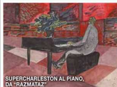
SUPERCHARLESTON AL PIANO, DA "RAZMATAZ"