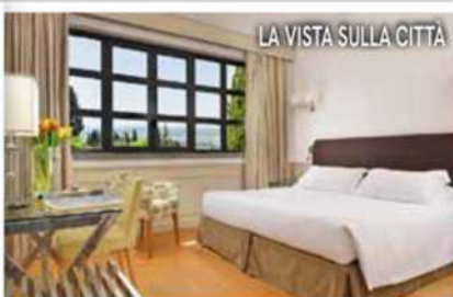
LA VISTA SULLA CITTÀ

Dove: sulle colline di Fiesole, da cui si ammira una splendida vista sui tetti di Firenze.