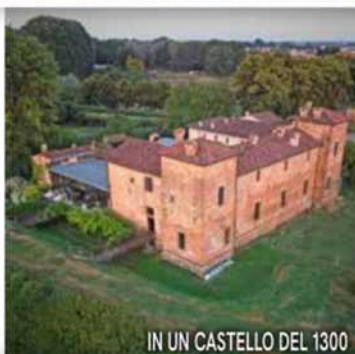
IN UN CASTELLO DEL 1300

I servizi e i prezzi: 2 ristoranti: l'"Antica Corte Pallavicina", stella Michelin, in cui lo chef Massimo Spigaroli propone una "cucina gastro-fluviale", che ospita le cantine di stagionatura più antiche al mondo (del 1320) con 5mila culatelli; l'"Hosteria del Maiale", con i piatti della tradizione. Doppia con colazione a buffet da 190 euro a notte. Info: www.anticacortepallavicinarelais.it