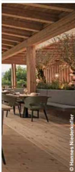
IL DESIGN CONTEMPORANEO DEL RISTORANTE