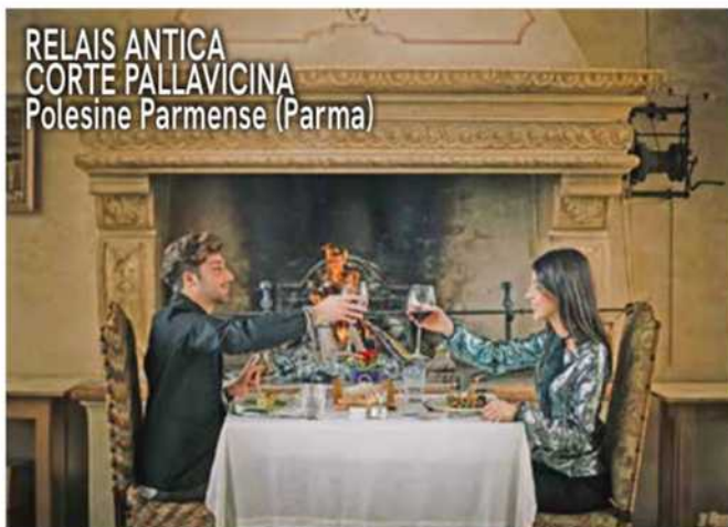
RELAIS ANTICA CORTE PALLAVICINA Polesine Parmense (Parma)