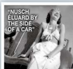
"NUSCH ÉLUD BY THE SIDE OF A CAR"