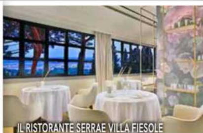
IL RISTORANTE SERRAE VILLA FIESOLE