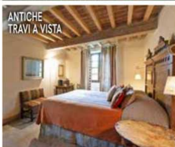
ANTICHE TRAVI A VISTA