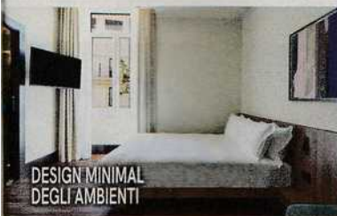
DESIGN MINIMAL DEGLI AMBIENTI