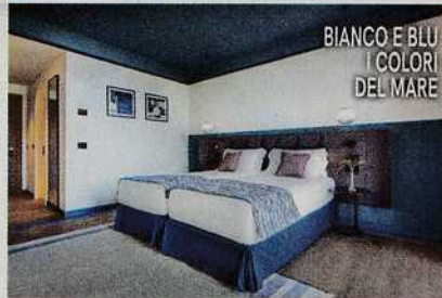
BIANCO E BLU I COLORI DEL MARE

La struttura e i prezzi: Ara Maris, un nuovissimo 5 stelle L di design. Tra i servizi: Thala Spa con sauna e bagno turco, dove coccolarsi con trattamenti body e viso. Sala fitness. Cora Bistrot, che serve piatti della tradizione preparati con ingredienti a km 0, e Lumi Sky Lounge, per un cocktail e tapas su una spettacolare terrazza con vista sul Golfo di Napoli. Doppia con colazione da 300 euro. Info: www.aramarishotel.com