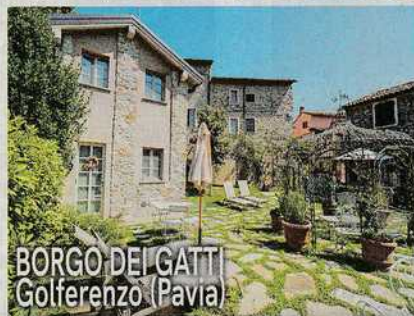
BORGO DEI GATTI Golferenzo (Pavia)

La struttura e i prezzi: un borgo medievale trasformato in un albergo diffuso di grande charme con dimore di varia tipologia. Tra i servizi: due ristoranti, Spa con sauna, idromassaggio, bagno turco. Cooking class di cucina del territorio Gite in e-bike, camminate con guida, nordic walking, yoga. Notte per due con colazione "a domicilio" da 130 euro a notte. Info: www.relaisborgodeigatti.it