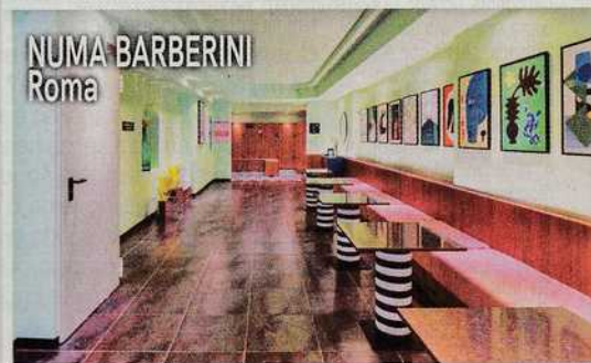
NUMA BARBERINI Roma