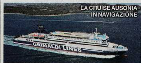
LA CRUISE AUSONIA IN NAVIGAZIONE

Grimaldi Cruise Ausonia, 13/17 novembre www.grimaldi-touropoperator.com