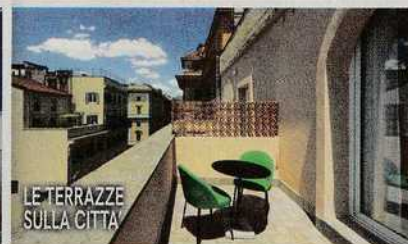
LE TERRAZZE SULLA CITTÀ

La serie: Tutto chiede salvezza 2 , da poco disponibile su Netflix dopo l'enorme successo della prima serie, girata nel reparto di psichiatria di un ospedale di Roma. Nel cast, Federico Cesari, Fotini Peluso, Drusilla Foer, Filippo Nigro e Ricky Memphis.