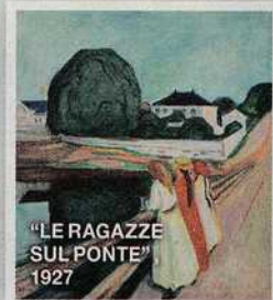
"LE RAGAZZE SUL PONTE" 1927

Milano, fino al 26 gennaio 2025 www.arthemisia.it www.palazzorealemilano.it