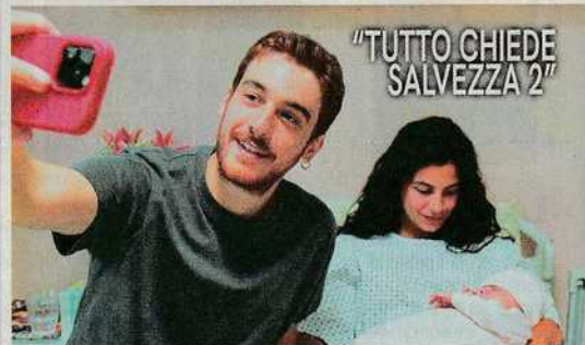
"TUTTO CHIEDE SALVEZZA 2"