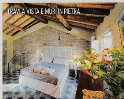
TRAVI A VISTA E MURI IN PIETRA