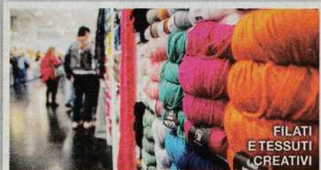
FILATI E TESSUTI CREATIVI