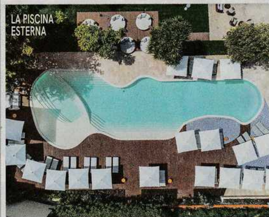
LA PISCINA ESTERNA