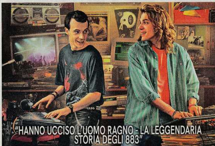
"HANNO UCCISO L'UOMO RAGNO - LA LEGGENDARIA STORIA DEGLI 883"

La serie: Hanno ucciso l'Uomo Ragno - La leggendaria storia degli 883 (Sky), ambientata a Pavia, che racconta l'amicizia tra Max Pezzali e Mauro Repetti, che insieme negli anni '90 hanno fondato gli 883.