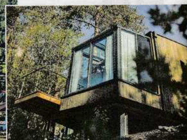
A sin., il villaggio di Saint-Pierre in Valle D'Aosta e, a ds., una stanza con pareti e soffitto in vetro della struttura Skyview Chalet, sul Lago di Dobbiaco, in Trentino Alto Adige.

Cerchiamo pertanto strutture ricettive che abbiano determinati requisiti rispettosi dell'ambiente». Ogni sera può essere ideale per ammirare le stelle, come cantava Alan Sorrenti "noi siamo figli delle stelle, figli della notte che ci gira intorno", però, di certo a ridosso del 10 agosto