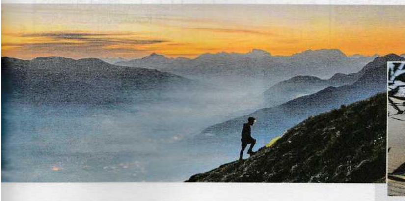
A sin., uno scalatore al tramonto sulle montagne della Carnia. Sotto, una Bubble Suite , presso l'antico Podere di San Francesco a Vada, in Toscana.

non risentono dell'inquinamento luminoso e dal Monte Zoncolan , la cima simbolo a 1.750 metri di regale altezza, si gode un panorama strepitoso. Con Visit Zoncolan ( www.visitzoncolan.com ) si può partecipare a un'escursione notturna, Le stelle di Avostanis , attorno al laghetto glaciale di Avostanis , o alla lanterna a cavallo in un bosco incantato, con la sola luce delle lampade a petrolio a guidare il cammino. Non mancano eventi legati all'astronomia grazie al progetto Luci Celesti Radici Terrestri + Stelutis Alpinis , un festival di divulgazione scientifica organizzato dal Collettivo Amalgama ( www.collettivolamalgama.com ), che indaga il rapporto che unisce l'uomo al