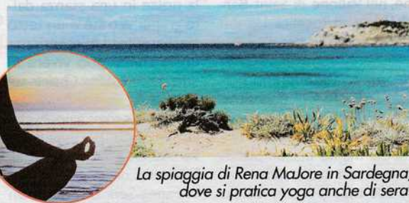
La spiaggia di Rena Majore in Sardegna, dove si pratica yoga anche di sera.

PER SAPERNE DI PIÙ www.astronomitaly.com