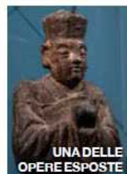
UNA DELLE OPERE ESPOSTE