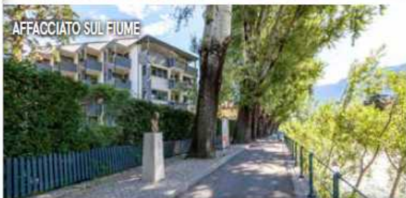
AFFACCIATO SUL FIUME

Il parco: i Giardini di Castel Trauttmansdorff, che si estendono su una superficie di 12 ettari e su un dislivello di oltre 100 m e presentano più di 80 paesaggi botanici. La mostra temporanea del 2024, Succu... cosa? , è incentrata sulle piante succulente. Info: www.trauttmansdorff.it