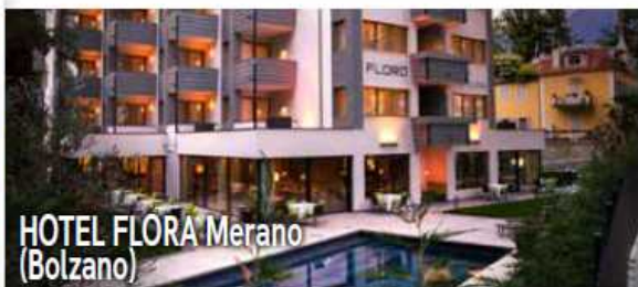
HOTEL FLORA Merano (Bolzano)