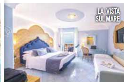
LA VISTA SUL MARE