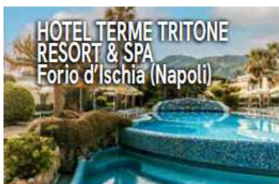
HOTEL TERME TRITONE RESORT & SPA Forio d'Ischia (Napoli)