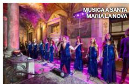
MUSICA A SANTA MARIA LA NOVA