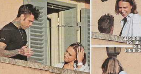
GLI SORRIDE E SI SIEDE SULLE GINOCCHIA

FEDEZ, "GIOCHI PROIBITI" CON LA SUA SEGRETARIA