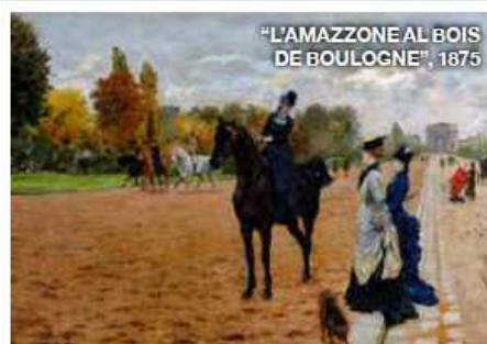
"L'AMAZZONE AL BOIS DE BOULOGNE", 1875

Milano. Fino al 30 giugno www.mostradenittis.it