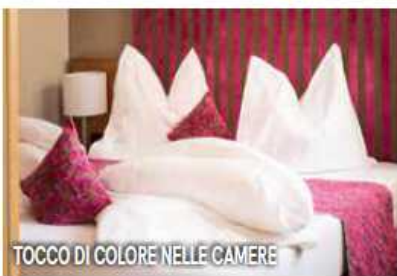
TOCCO DI COLORE NELLE CAMERE

I servizi e i prezzi: bar, piscina riscaldata esterna con area relax, giardino. Scelta di massaggi e trattamenti nel vicino City Hotel Merano. Sala giochi e parco giochi per bambini. Notte con colazione in doppia a partire da 89 euro a persona. Info: www.hotelsmerano.it/hotel-flora-merano/