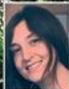
di Simona Cortopassi

Turismo Aria di primavera, di voglia di scampagnate nella natura, di scorci e di