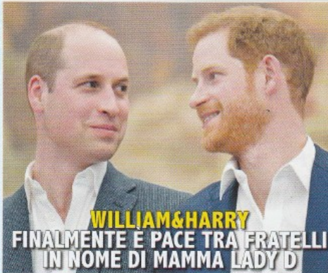
WILLIAM & HARRY FINALMENTE È PACE TRA FRATELLI IN NOME DI MAMMA LADY D