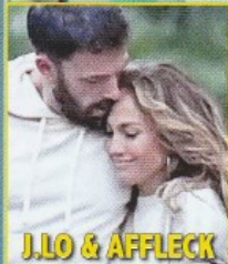
J.LO & AFFLECK

SORPRESI IN INTIMITÀ... SONO LA COPPIA PIÙ ROMANTICA DELL'ESTATE