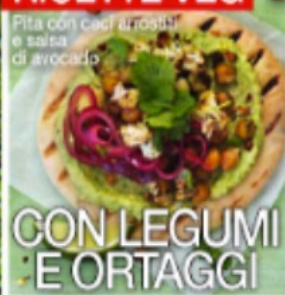
Pita con ceci arrostiti e salsa di avocado