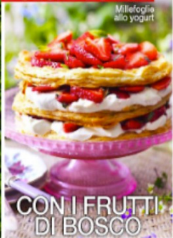
Millefoglie allo yogurt