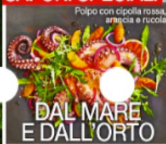
Polpo con cipolla rossa, arancia e rucola