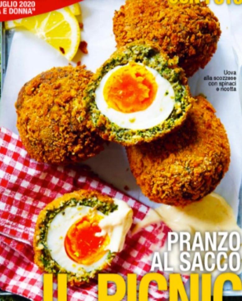
Uova alla scozzese con spinaci e ricotta