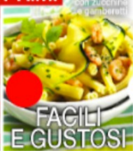
Caseracco con zuccina e gamberetti