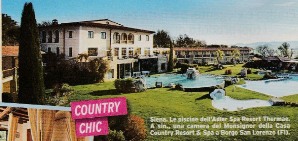
Siena. Le piscine dell'Adler Spa Resort Thermae. A sin., una camera del Monsignor della Casa Country Resort & Spa a Borgo San Lorenzo (Fi).

Nelle belle giornate la Regione più artistica d'Italia si accende di caldi colori che invitano a partire per weekend romantici, culturali o gastronomici. E le tariffe sono da bassa stagione