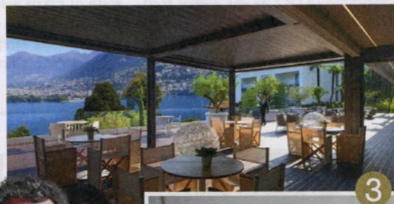
SAKIS LALAS / WWW.SAKISLALAS.COM