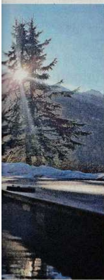
IL NATURAL SPA CHALET