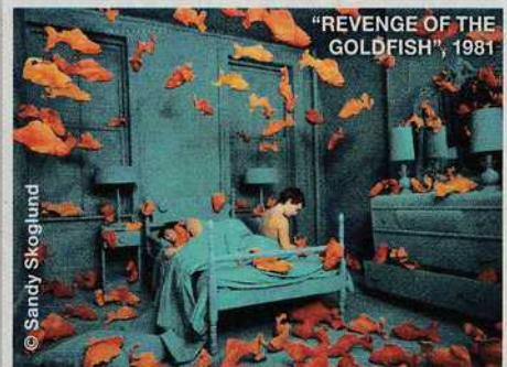
"REVENGE OF THE GOLDFISH", 1981