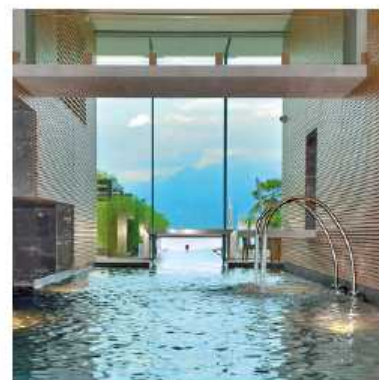
Bagni Termali Salini

I Bagni termali Salini e Spa di Locarno , in Svizzera , sono famose per le acque saline naturali e offrono una vista spettacolare sul lago e le montagne del Ticino. La costruzione sorge direttamente in riva al lago Maggiore mentre l'architettura interna riprende le caratteristiche delle