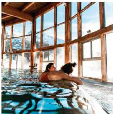
Les Grands Bains du Monétier

rato più concentrata al mondo, il che la rende una destinazione privilegiata per le cure dei disturbi della pelle e delle infiammazioni nel sistema muscolo-scheletrico. Terme Smrdàky si trova ad un'ottantina di chilometri dalla capitale Bratislava e fa parte del complesso delle terme di Piestany. A Smrdàky è possibile godere di soggiorni curativi ideali per bambini affetti da malattie croniche della pelle (per es.