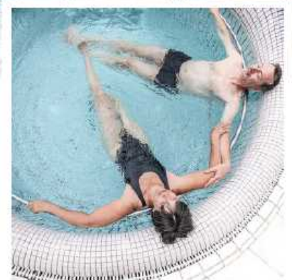
Aix-les-Bains Riviera des Alpes