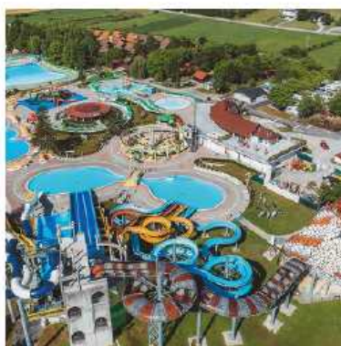
Aqualuna. Terme Olimia

L e terme sono da sempre considerate un luogo ideale per il benessere fisico e mentale. L'acqua termale, con le sue proprietà terapeutiche, rappresenta una risorsa naturale preziosa per il nostro organismo. Numerosi studi scientifici hanno dimostrato che i trattamenti termali apportano benefici significativi alla salute, riducendo lo stress e stimolando il sistema immunitario. Molte località termali sono anche un luogo di divertimento e relax per tutta la famiglia e offrono servizi e attività adatte a più piccoli, rendendo l'esperienza indimenticabile per adulti e bambini.