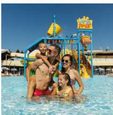
Terme Tuhelj foto panoramica Julien Duval. Foto famiglia Nino Verdnik

da interna ed esterna, sauna, hammam, spazio trattamenti (massaggi, forma, idroterapia, scrub...).