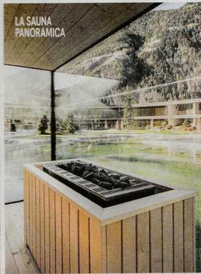
LA SAUNA PANORAMICA

La meta e la struttura: la Valle Aurina, in una zona che vanta 35 laghi di montagna, 10 cascate, torrenti e ghiacciai. E' un vero paradiso per coppie completamente autosufficiente dal punto di vista energetico, inaugurato solo due mesi fa, con 33 tra camere ed eco-apartsuite - di cui 25 con sauna privata - dove design, natura e lusso informale si integrano alla perfezione creando un ambiente magico e pervaso da un'energia speciale. I servizi e i prezzi: Spa con piscina coperta ed esterna riscaldata, due saune, bagno turco, percorso Kneipp, laghetto balneabile, sala relax, yoga e fitness, due sale per i massaggi. Ristorante guidato dallo chef Berni Aichner, lounge bar. Da 111 euro a persona a notte. Info: www.olm.it