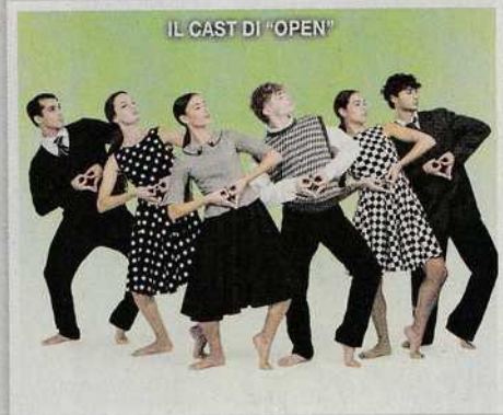
IL CAST DI "OPEN"