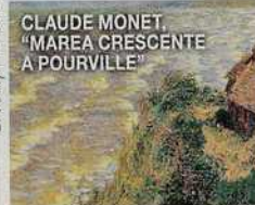
CLAUDE MONET, "MAREA CRESCENTE A POURVILLE"