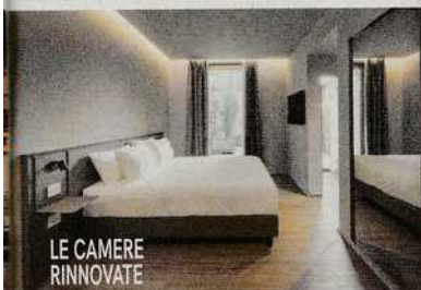
LE CAMERE RINNOVATE