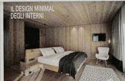
IL DESIGN MINIMAL DEGLI INTERNI

La meta e la struttura: la Valle Aurina, in una zona che vanta 35 laghi di montagna, 10 cascate, torrenti e ghiacciai. E' un vero paradiso per coppie completamente autosufficiente dal punto di vista energetico, inaugurato solo due mesi fa, con 33 tra camere ed eco-apartsuite - di cui 25 con sauna privata - dove design, natura e lusso informale si integrano alla perfezione creando un ambiente magico e pervaso da un'energia speciale. I servizi e i prezzi: Spa con piscina coperta ed esterna riscaldata, due saune, bagno turco, percorso Kneipp, laghetto balneabile, sala relax, yoga e fitness, due sale per i massaggi. Ristorante guidato dallo chef Berni Aichner, lounge bar. Da 111 euro a persona a notte. Info: www.olm.it