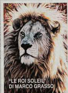
"LE ROI SOLEIL" DI MARCO GRASSO