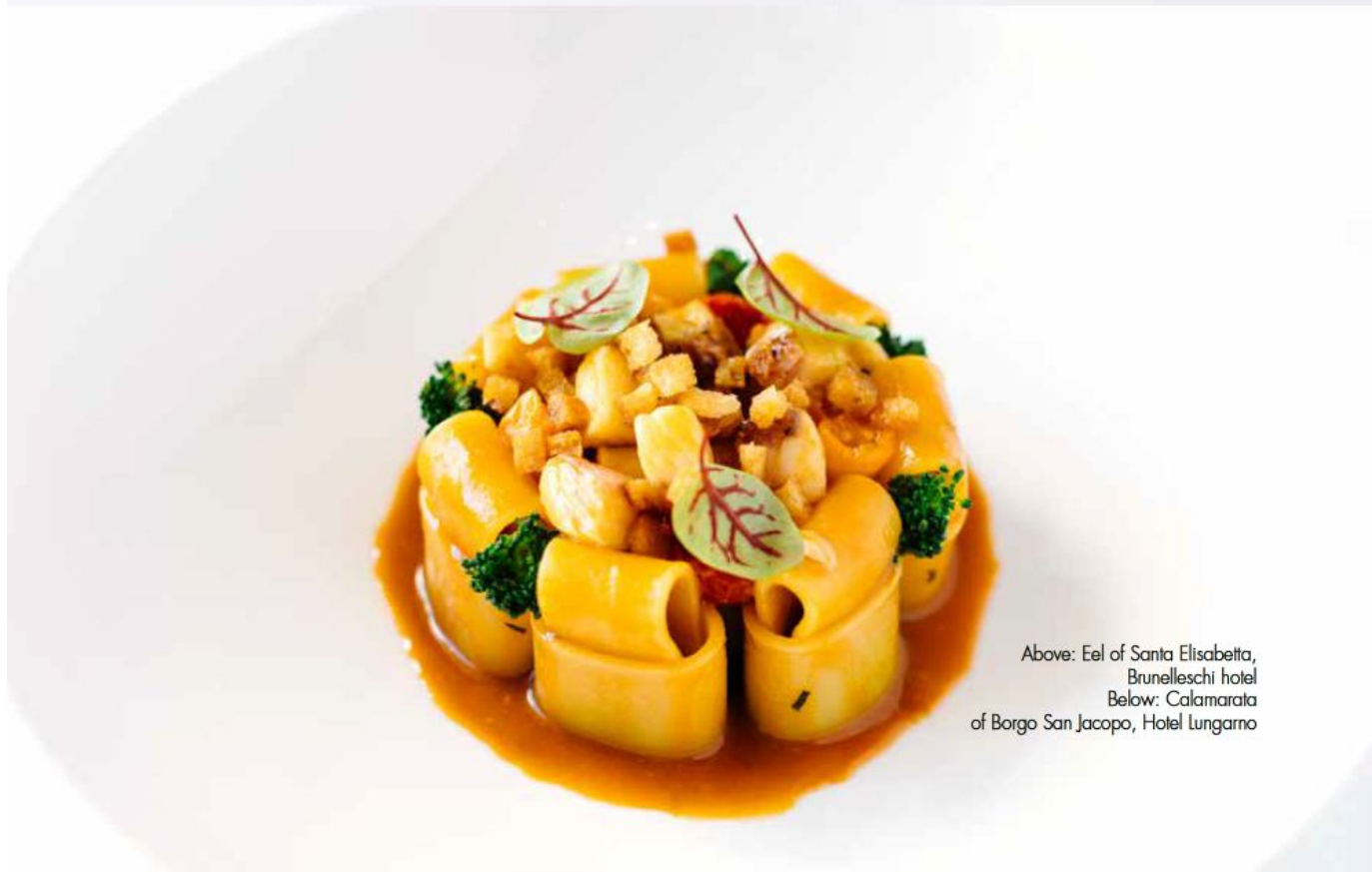
Above: Eel of Santa Elisabetta, Brunelleschi hotel Below: Calamarata of Borgo San Jacopo, Hotel Lungarno