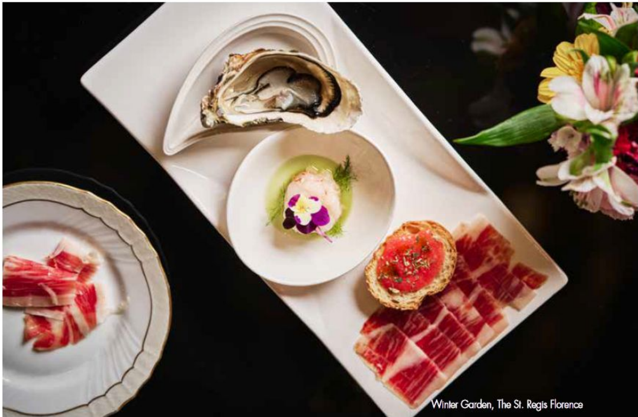
Winter Garden, The St. Regis Florence

Autumn is a magical and special season also for food! Warm and intense flavours to heat you up when the temperature gets cooler.