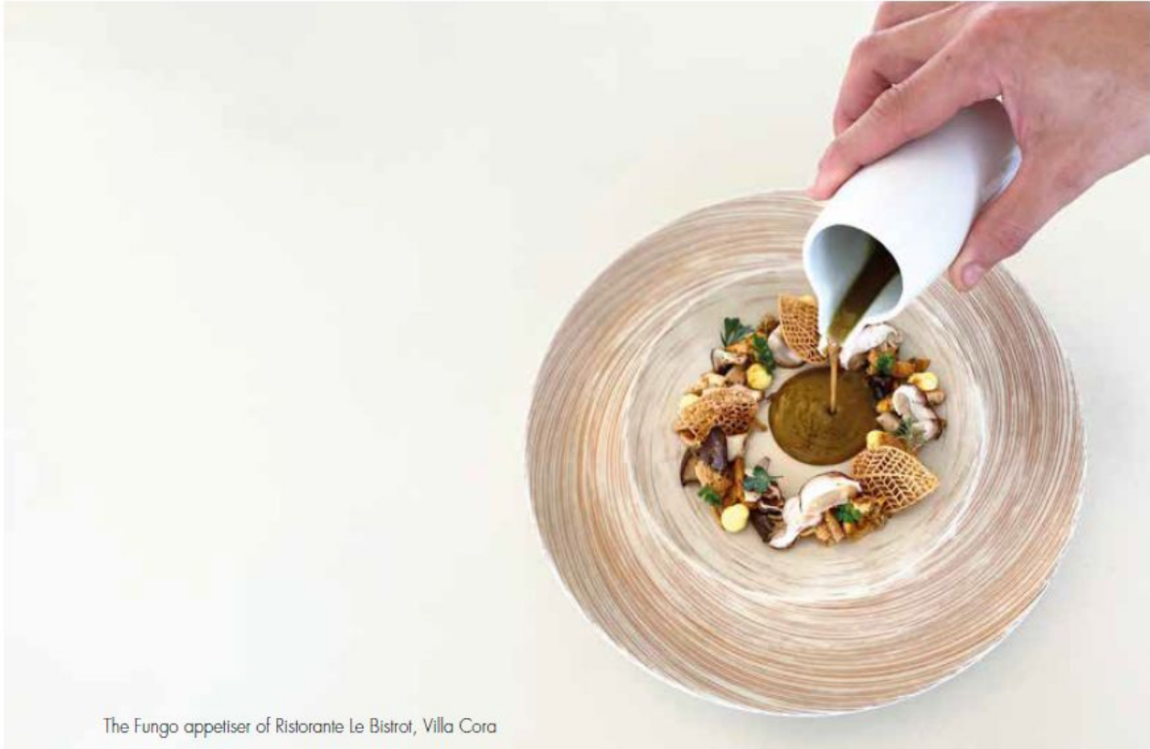
The Fungo appetiser of Ristorante Le Bistrot, Villa Cora

An example? The Porcini Mille-feuille, a puff-pastry tartlet with duxelles of porcini and porcini gills. A dish which perfectly reflects the philosophy of Cibrèo's cuisine, where dishes always retain tradition and authentic complexity ( Via dei Vecchiotti, 5 ).