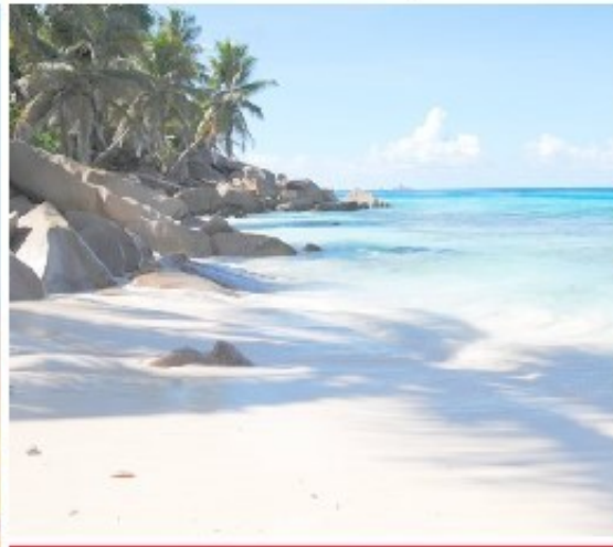
Un'immagine del bel Seychelles, il cui territorio è diviso in 115 isole, localizzato nel Pacifico Indiano, circa 1500 chilometri al di là delle coste dell'Africa Orientale. Il numero di abitanti non arriva a centomila, è frutto dell'isola perdoni lo abitanti, molti a popolazione. Nel lo scudo Seychelles è il bene del bene un ruolo da protagonisti è