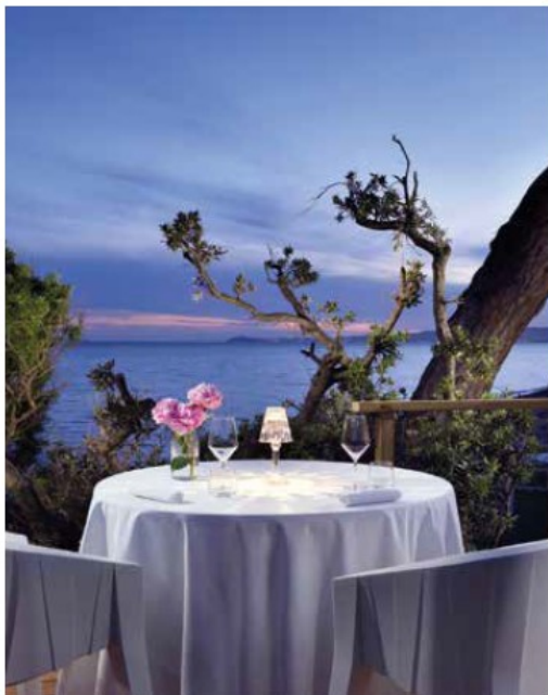
_ DALL' ALTO _ Una camera dell'Hotel, vista dall'alto della spiaggia, il ristorante sul mare

del territorio: dalla botanica del parco secolare e la geologia delle dune, all'archeologia del sito (nel parco si trovano ancora tracce degli insediamenti etruschi di oltre duemila anni fa: piccoli sassi scuri nella sabbia, reperti delle fusioni di materiale ferroso di provenienza etrusca che il mare e i venti hanno portato fino a qui dalla vicina isola Elba). Oltre alle passeggiate all'interno dei giardini e del parco del Resort, a disposizione degli ospiti della struttura ci sono dei percorsi botanici, studiati con l'aiuto di cartine ad hoc per scoprire i profumi e i colori delle specie endemiche e di macchia mediterranea presenti nel vasto parco. La struttura ha messo in atto una serie di azioni per favorire un turismo responsabile che include l'utilizzo di materie prime a filiera corta, sistemi di risparmio idrico, l'acquisto di prodotti compostabili, la valorizzazione dei servizi e delle attività locali e un'attenzione speciale al riciclo e al rispetto per l'ambiente.