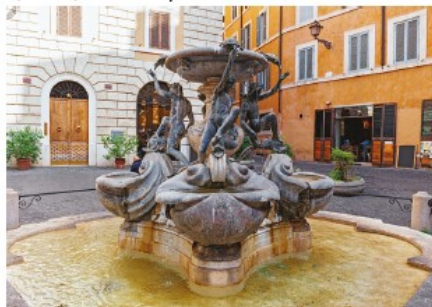
Due luoghi suggestivi e poco noti di Roma: a sin., la Fontana delle Tartarughe al Ghetto, e, a ds., l'antica Spezieria di Santa Maria della Scala, a Trastevere, attiva fino al 1954.

strargli che, anche senza soldi, restava sempre un potente e nobile signore romano, capace di ottenere quel che voleva, fece realizzare in una sola notte questa magnifica fontana. Il giorno seguente, invitò a palazzo la promessa sposa e suo padre per mostrare loro l'opera e, di fronte al loro stupore, esclamò: «Ecco che cosa è in grado di realizzare in poche ore uno squattrina-