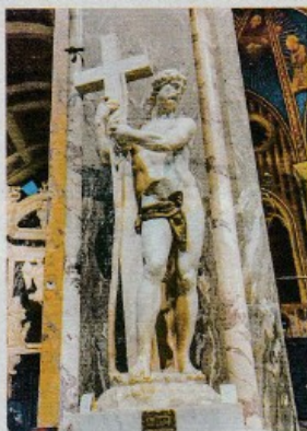
Il Cristo Portacroce di Michelangelo e, sopra, la Chiesa di Santa Maria della Pace. Sotto, il Laghetto di Villa Borghese.

una delle amanti del pittore rinascimentale Raffaello Sanzio, forse la celebre Fornarina.