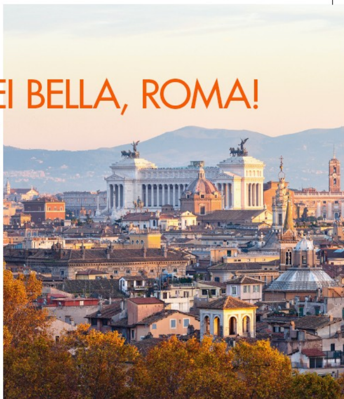
Sopra, lo skyline della Città Eterna. A sin., in basso, Palazzo Riario Corsini, e, in alto, Piazza di Spagna, con la celebre scalinata di Trinità dei Monti ai cui piedi sorge la Fontana della Barcaccia.

Se pensavate di conoscerla, preparatevi a sorprendervi, perché la città eterna, accanto alle bellezze note in tutto il mondo, regala indirizzi fuori dai soliti giri turistici che lasciano incantati. Una città che nasconde magia ovunque, anche nei suoi luoghi meno canonici. Si gira e si ha la sensazione che questa Urbe, che un tempo ha dominato il mondo, ci appartenga, nonostante il traffico, il caos, la difficoltà dei parcheggi. Come scriveva lo scrittore Henry James, "si cammina per le strade in una febbre di gioia". Qua e là le bancarelle dei mercati rionali che si riempiono di carciofi, fave e ciliegie, insieme ai loro colori accesi, le cupole delle chiese che si alzano nel cielo quasi fossero mongolfiere, il suono dell'acqua delle fontane che scivola sulla pietra... E proprio da una celebre fontana di Roma parte il nostro