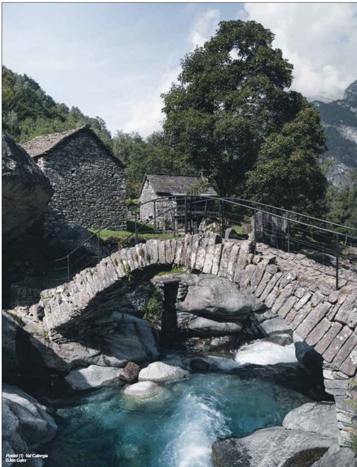
Puntid (1) - Val Calnegia