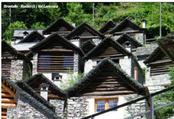
Bronfallo - Rustici (5) Val Lavizzara

Il mulino ad acqua di Bruzella (1983-96), di cinque nevére (antichi edifici usati per la conservazione al fresco del latte prima della sua lavorazione, 1997-2012), due roccoli (1997-1999), una cisterna e altri elementi del paesaggio culturale tradizionale sono davvero interessanti da vedere. Dal 2007 il MEVM si dedica anche al restauro di muri a secco, come ad esempio lungo il pittoresco sentiero tra Scudellate ed Erbonne. Con una mostra ed un libro si è ricostruita la storia della scoperta del Monte Generoso.