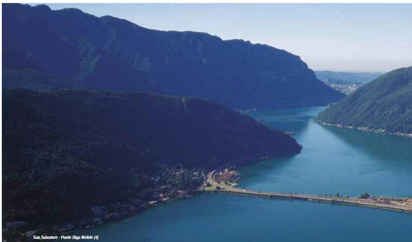
San Salvatore - Ponte Diga Melide (4)