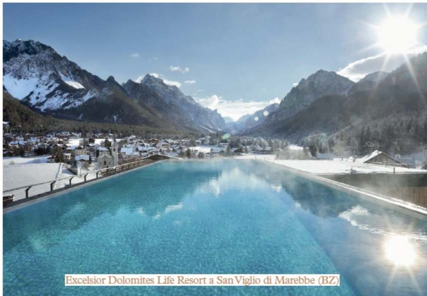
Excelsior Dolomites Life Resort a San Viglio di Marebbe (BZ)