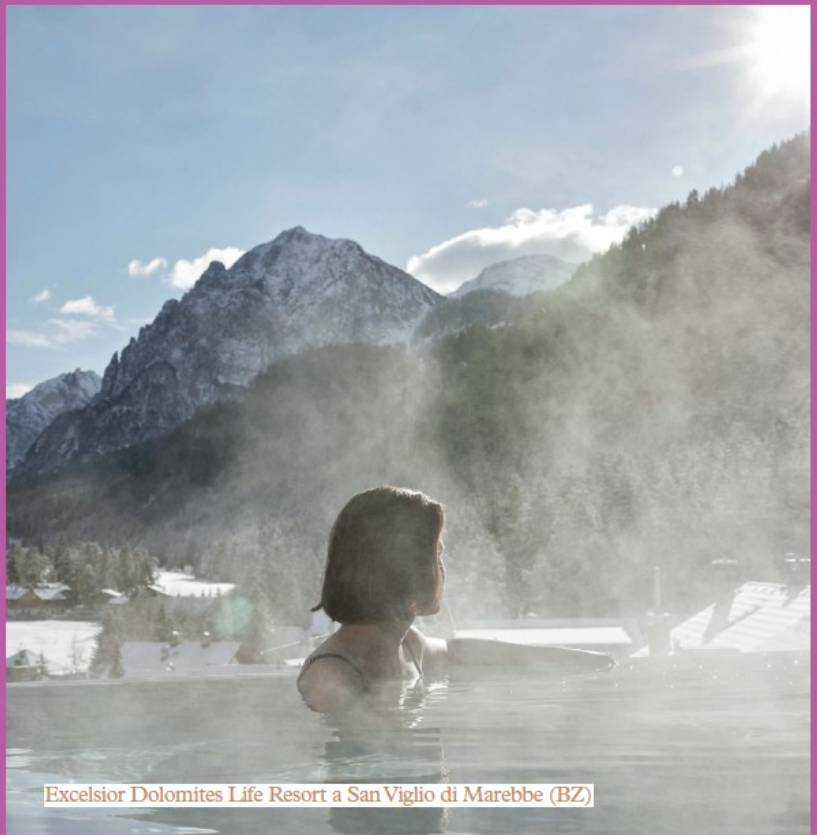
Excelsior Dolomites Life Resort a San Viglio di Marebbe (BZ)

Nel 2019, l'Excelsior Dolomites Life Resort a San Viglio di Marebbe (BZ) ha inaugurato l'Excelsior Dolomites Lodge, collegato al corpo centrale dell'hotel da passaggi coperti sotterranei. Sul rooftop del nuovo nato, all'interno della Dolomites Sky Spa, destinata esclusivamente agli adulti, campeggia la spettacolare infinity pool. Si tratta di una piscina esterna a sfioro, collegata a una vasca interna, da dove lo sguardo domina i tetti del pittoresco paesino della Val Badia rimanendo incantato al cospetto delle Dolomiti, con una vista quasi a 360°. Immergersi in questa grande vasca significa diventare parte del paesaggio e ricevere la benefica energia delle montagne più belle del mondo. L'infinity pool è anche ecologica: è stata realizzata in poliuretano, consumando così il 30% di energia in meno rispetto a una piscina costruita in acciaio inossidabile o in cemento. Il sofisticato canale di scarico, il sistema di disinfezione e il recupero del calore di OSPA consentono inoltre di risparmiare un ulteriore 20% in costi energetici.