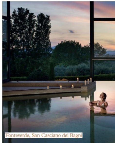
Fonteverde, San Casciano dei Bagni