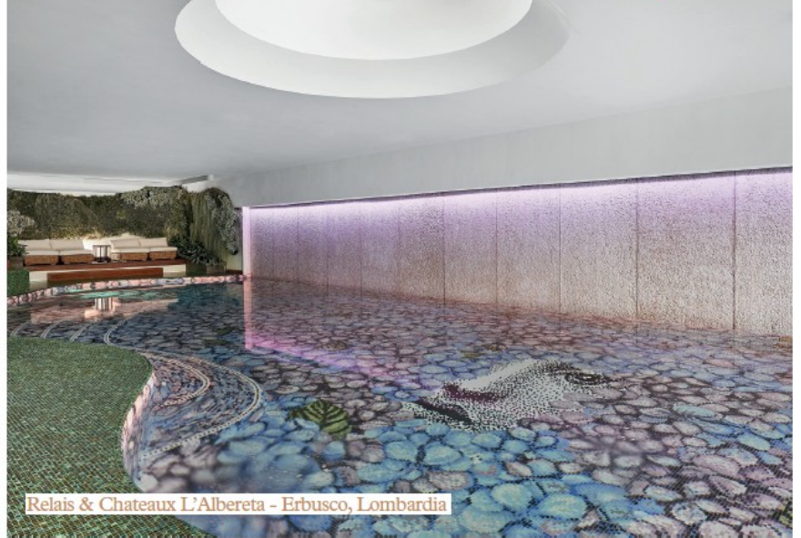
Relais & Chateaux L'Albereta - Erbusco, Lombardia