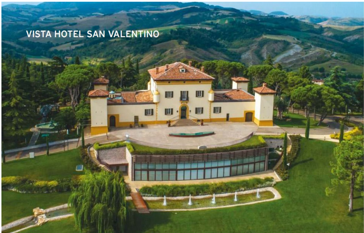
Palazzo di Varignana, a Castel San Pietro Terme, elegante struttura sulle colline bolognesi, ricavata da una villa del '700 restituita all'antico splendore.

licella con degustazione vini. E per i sognatori romantici dei fasti regali, il "Relais Castello Bevilacqua" (Via Roma, 50 a Bevilacqua, in provincia di Verona) offre un menù delivery con prodotti del territorio eccezionali come il Culatello di Zibello oppure una fuga romantica da fare in giornata o con una notte al castello proposta dal pacchetto "Ginevra e Lancillotto".