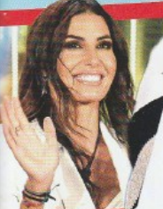
ELISABETTA GREGORACI "MI SONO ANNULLATA PER BRIATORE"