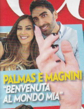
PALMAS E MAGNINI "BENVENUTA AL MONDO MIA"