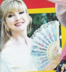
MILLY CARLUCCI BALLANDO CON LE STELLE!