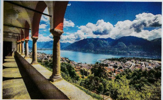
Locarno: vista dal Santuario della Madonna del Sasso, a Orselina.