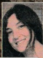
di Simona Cortopassi

Sulle tracce di Dante e Beatrice nel cuore di Firenze o a Napoli, mano nella