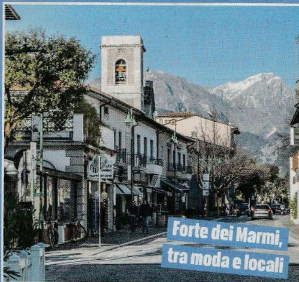
Forte dei Marmi, tra moda e locali

A Forte dei Marmi si lanciano mode, nascono amori e si vive la "bella vita" dei locali notturni e alla moda. I più sportivi non si annoieranno, potranno scegliere tra free climbing sulle Alpi Apuane, oppure corsi di vela tra il mare e il lago di Massaciuccoli. Il mare permette anche, con condizioni favorevoli, di esercitare il Surf.