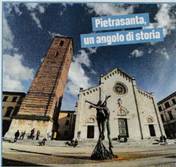
Pietrasanta, un angolo di storia

Molti artisti hanno eletto questo angolo di paradiso a loro residenza preferita.