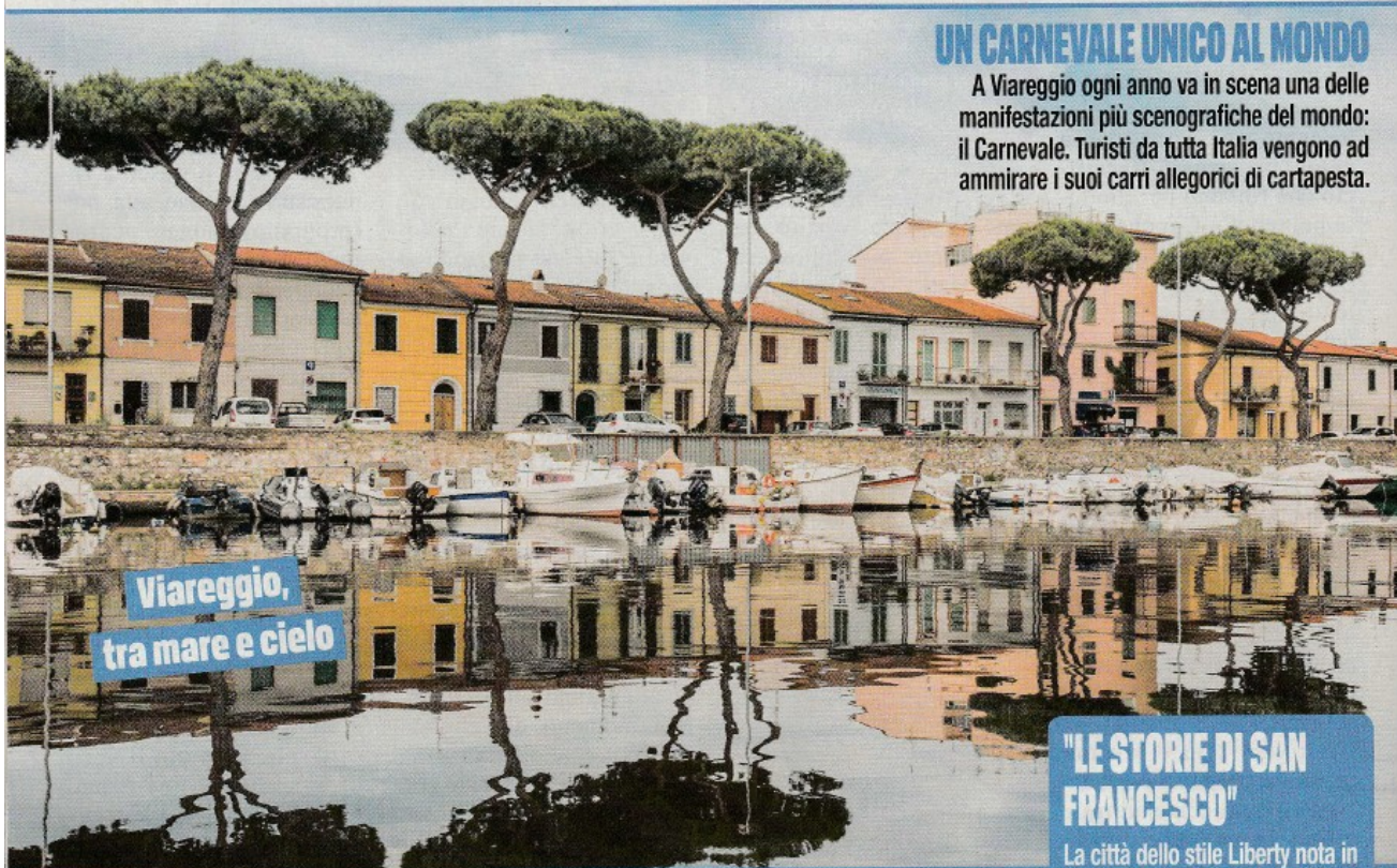
Viareggio, tra mare e cielo

Dalle spiagge alla montagna, dalle gite culturali a quelle sportive: difficile scegliere!