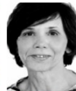
di Lucia Siliprandi

Parco dei Principi Grand Hotel & Spa via Frescobaldi 5 - 00198 Roma Tel 06 854421 www.parcodeiprincipi.com