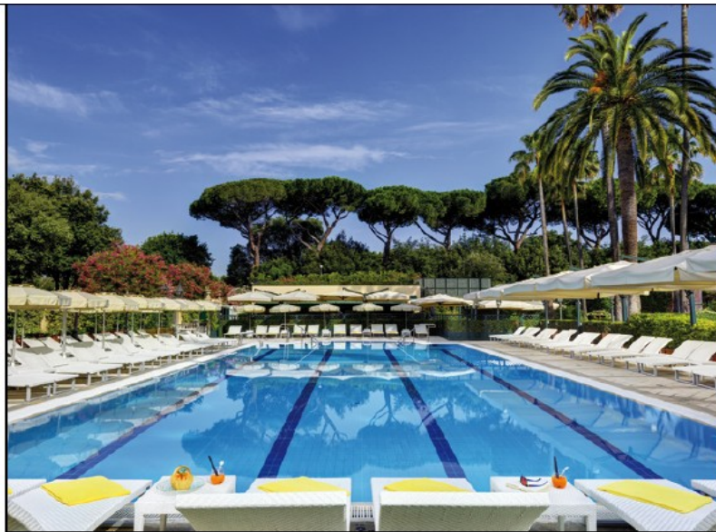
PARCO DEI PRINCIPI, OASI FUORI ROMA PER RITROVARE LA PROPRIA INTIMITÀ

Nella città eterna, a pochi passi da via Veneto, sorge il Parco dei Principi Grand Hotel & Spa. Il resort urbano fa parte della Roberto Naldi Collection, che annovera cinque alberghi di lusso, differenti l'uno dall'altro ma accomunati da un'impronta fortemente italiana e da uno spirito cosmopolita. L'edificio, il cui progetto risale al 1964 a firma dell'architetto Gio Ponti, è attorniato da un rigoglioso giardino botanico.