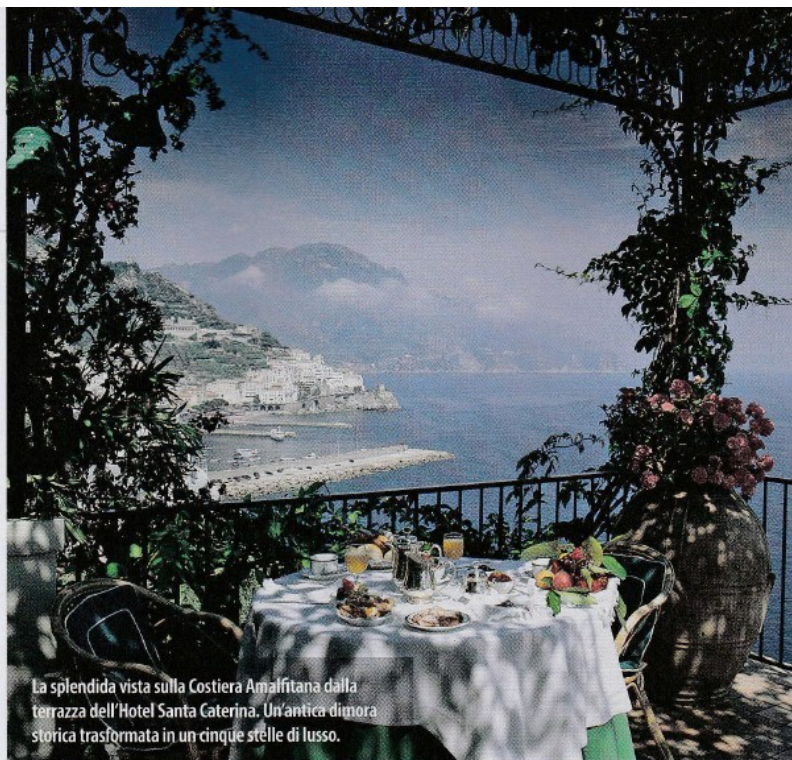
La splendida vista sulla Costiera Amalfitana dalla terrazza dell'Hotel Santa Caterina. Un'antica dimora storica trasformata in un cinque stelle di lusso.

A pochi minuti di distanza dalla stupenda Amalfi, in uno dei punti più suggestivi della Costiera Amalfitana, si trova l'Hotel Santa Caterina, un'antica dimora storica con 36 camere di varie tipologie, da standard a deluxe, e una suite-gioiello: la "Follia Amalfitana", con minipiscina tonda e vetrata con vista mozzafiato sulla baia. L'esclusiva struttura si trova a picco sul mare, all'interno di una vasta proprietà che precipita fino all'acqua con una serie di stupende terrazze naturali. Due ascensori scavati nella roccia e un sentiero di spettacolare bellezza conducono, attraverso agrumeti e giardini lussureggianti, agli impianti a livello del mare, che comprendono una piscina con acqua di mare, solarium, fitness-centre vista mare, caffè/bar e ristorante all'aperto. Imperdibili le escursioni organizzate per andare a visitare gli scavi di Pompei che, insieme a quelli di Ercolano e di Oplontis, sono stati dichiarati Patrimonio dell'Umanità. Chi preferisce la vita da mare, può partecipare alle escursioni in barca o motoscafo verso le spiagge più belle e le magnifiche grotte, compresa la leggendaria Grotta dello Smeraldo. A una cinquantina di chilometri dall'Hotel Santa Caterina si trova il Parco Nazionale del Vesuvio, raggiungibile anche con viaggi orga-