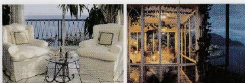
A lato: uno scorcio dell'elegante ristorante dove si cena a lume di candela, ammirando il suggestivo panorama di Amalfi illuminata dalla luna.