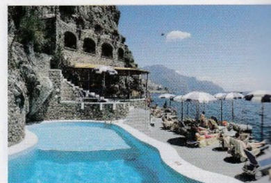
Lo splendido scenario dell'Hotel Santa Caterina, con le terrazze e la piscina a picco sul mare.

Location di super lusso per occasioni davvero speciali. In bassa stagione a partire da 392 euro a notte per 2 persone con colazione. In alta, la stessa tipologia di camera da 1.175 euro a notte, sempre per 2 persone, scende a 1.023 euro a settembre. • Info: Hotel Santa Caterina, Amalfi (Sa). Tel. 089.871012; www.hotelsantacaterina.it