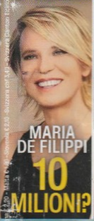
MARIA DE FILIPPI