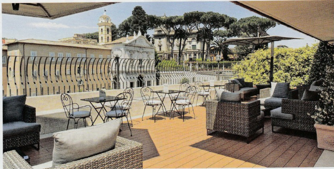
ROMA | HOTEL DEGLI ARTISTI