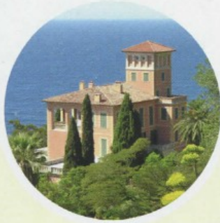
LIGURIA VENTIMIGLIA - MORTOLA

I Giardini Hanbury ( www.giardinihanbury.com ), candidati all'Unesco come Patrimonio dell'Umanità, sorgono sul promontorio della Mortola (Im), sulla costa ligure, a pochi chilometri dal confine francese. Ingresso: 7,50 euro, 6-14 anni 6 euro, biglietto famiglia 20 euro.