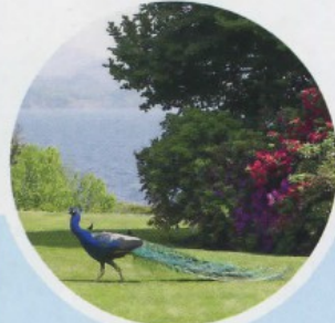
PIEMONTE LAGO MAGGIORE