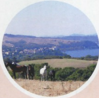
LAZIO LAGO DI BRACCIANO

Hotel Piccolo Lido: doppia b&b da 112 euro, bambini fino a 4 anni gratuito, 5-12 anni 31 euro. Hotel Parigi: doppia b&b da 160 euro, tripla da 200 euro. Hotel Prince de Galles: doppia b&b da 140 euro, tripla da 160; mezza pensione suppl. 24-36 euro, bambini 13 euro.