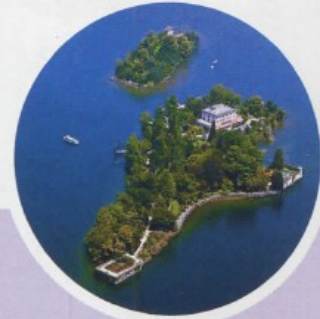
SVIZZERA ASCONA E LUGANO

Hotel Torre Sant'Angelo: offerta fino al 14 giugno, doppia b&b da 89 euro prima notte, 79 euro la seconda e 69 la terza. Casa del Sole: doppia b&b da 75 euro, bambini 50 per cento di sconto. Appartamenti b&b da 966 euro a settimana.