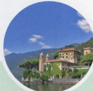
LOMBARDIA LAGO DI COMO