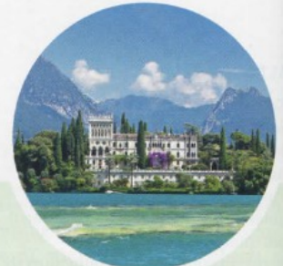
VENETO LAGO DI GARDA