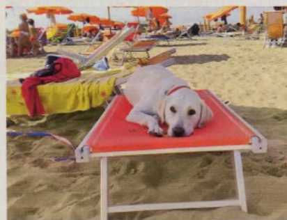
A sinistra, la spiaggia di Pluto a Bibione (VE) con i lettini per i pet. Sotto, le terme di Fonteverde (SI).