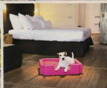
Le cuccie di design di Doggly ( doggly.com ) accolgono gli ospiti con la coda nei Romantik hotel.

Per il 43,3% di italiani (dati Eurispes 2016) che vivono con un animale domestico gli operatori turistici quest'estate offrono hotel pet friendly e servizi sempre più raffinati. Come quelli che ti raccontiamo qui.