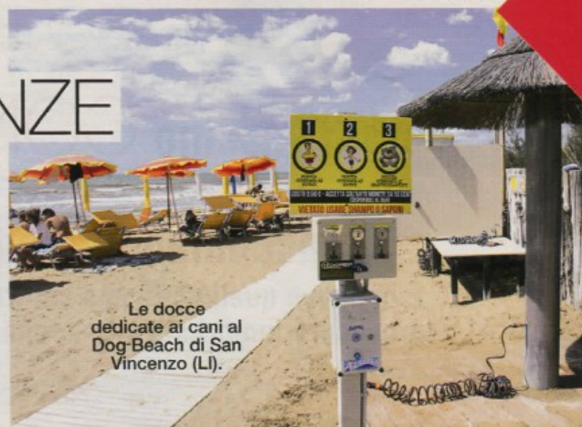
Le docce dedicate ai cani al Dog-Beach di San Vincenzo (LI).