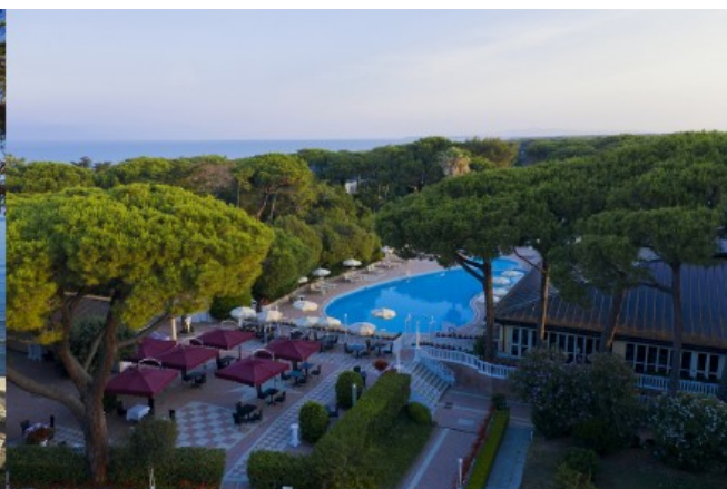
Park Hotel Marinetta

Si terranno l'8, 9, 10 e 11 novembre dalle ore 9.00 alle 17.00 i Recruiting Days per selezionare 200 figure professionali altamente qualificate che possano essere protagoniste dell'accoglienza nelle due strutture del gruppo: il The Sense Experience Resort e il Park Hotel Marinetta . Chi cerca lavoro nel settore alberghiero lo troverà quindi sicuramente con Icon Collection, azienda giovane e dinamica del gruppo imprenditoriale Ficcanterri, che punta ad aprire per la prossima stagione 2023 con un personale preparato, ambizioso, appassionato e motivato, garantendo a tutti una serie di interessanti benefits. Le selezioni avverranno al Park Hotel Marinetta il prossimo 8 e 9 novembre e al The Sense Experience Resort il 10 e 11 novembre.