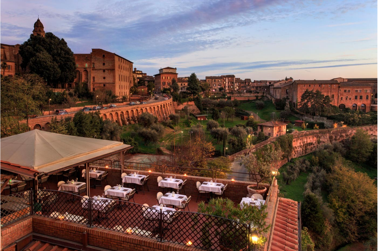
Terrazza San Marco - Hotel Athena, Siena

Un tavolino a cielo aperto, il gradevole aroma di un cocktail colorato e, di fronte, un meraviglioso scenario da ammirare; ecco gli ingredienti della felicità! Ma se a questi elementi aggiungiamo l'accoglienza di una struttura confortevole e la cortesia di uno staff qualificato, siamo nel posto giusto per trascorrere un pomeriggio o una serata davvero indimenticabile